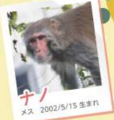
ナニ メス 2002/5/15 生まれ