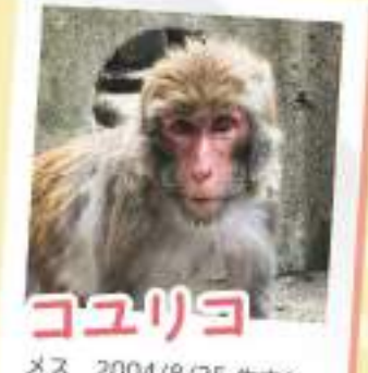
コユリョ メス 2004/8/25 生まれ