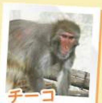
チーコ メス 1997/5/22 生まれ