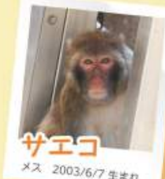
サエコ メス 2003/6/7 生まれ