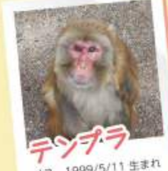
テンプーラ メス 1999/5/11 生まれ