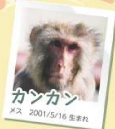
カンカン メス 2001/5/16 生まれ