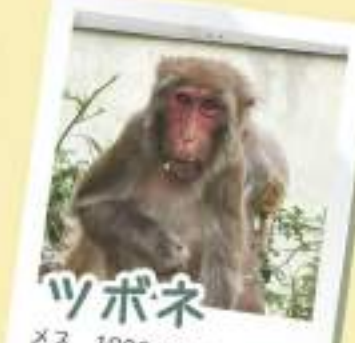
ツポネ メス 1998/6/7 生まれ