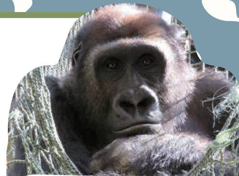
ニシゴリラ「ゲンタロウ」