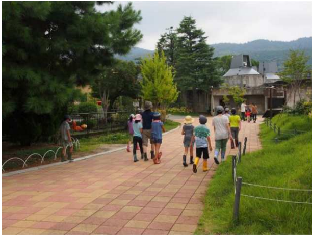
・ヨシのワークショップ準備