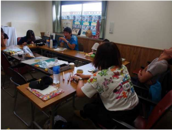
・ブーブー笛ワークショップ