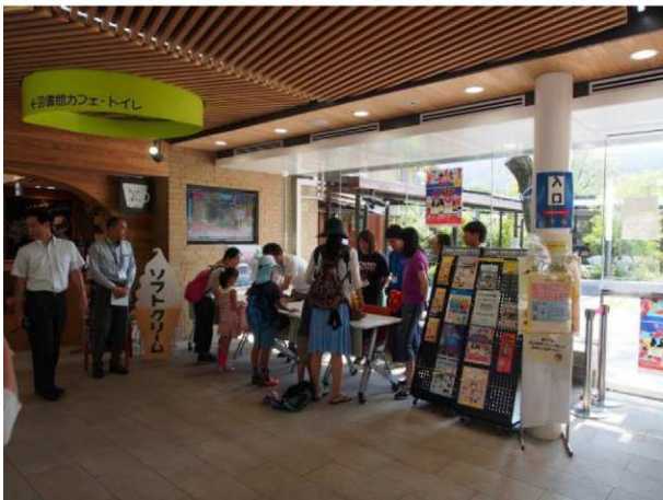
・若沖ワークショップ