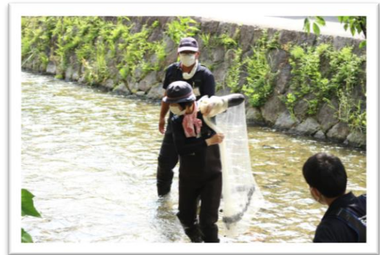
手持ちの網のほかに、投網も使いました！