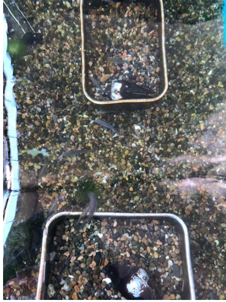
貝のそばを泳いでいます。

4月に屋外のタナゴ飼育場に移動したタナゴたち。新しい環境に慣れず、水温が低いうちはエサを与えても全く寄ってきませんでした。が、暖かくなった今では、水面のエサをはねながら食べるほど食欲旺盛になっています。オスが貝の周りで縄張りを張る様子や、産卵管が長く伸びているメスも見られ、期待が膨らみます。