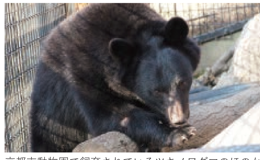
京都市動物園で飼育されているツキノワグマのほのか

前半はヒグマの生態、後半はツキノワグマの生理(冬眠と繁殖)について、最近の研究結果をわかりやすく紹介していただきます。