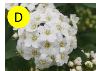
D コデマリ(バラ科) 4-5月 優雅、上品、友情