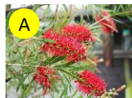
A ブラシノキ(フトモモ科) 5-6月 恋の火、恋の炎