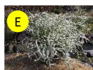
E ユキヤナギ(バラ科) 3-4月 愛嬌、愛らしさ