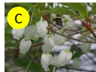
C ドウダンツツジ(ツツジ科) 4月中旬-5月上旬 上品、節制