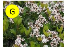
G ヒメシャリンバイ(バラ科) 4-6月 愛の告白、純真