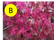
B トキワマンサク(マンサク科) 4-5月上旬 私から愛したい