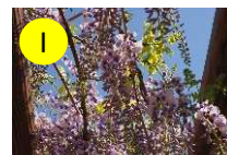
I フジ(マメ科) 4-6月 優しさ、歓迎