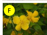
F ヤマブキ(バラ科) 4-5月 気品、崇高、金運