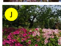
J ヒラドツツジ(ツツジ科) 4-5月 節度、慎み