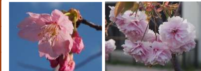
オオシマザクラ フゲンゾウ