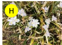
H シャガ(アヤメ科) 4-5月 反抗、友人が多い