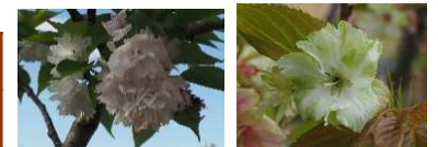
イチハラトラノオ ウコン