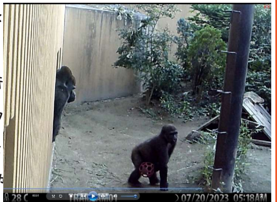
↑朝の5時台からお気に入りの赤いボールを持って走るキンタロウとそれを見守るモモタロウ。

夜間放飼を始めて1ヶ月ほど経ちました。夜間の映像を確認していると、夕方6時台までは主にゲンタロウやキンタロウがグラウンドで餌を食べる姿が映っていることが多いです。その後暗くなり始める7時台から朝明るくなり始める4時台くらいまでは室内にいることが多いようです。ただ、たまにゲンタロウが夜中に30分から1時間ほどグラウンドでのんびり過ごしているのが記録されていることもあります。朝の4時台くらいからはモモタロウ以外の3頭が時々グラウンドに出てきて、どこからか見つけてきた枝葉などを食べたり、遊んだりする様子が映っています。モモタロウは、出入り口で他の個体を眺めたり、トイレに出てきたり…というのが多い気がします（笑）インドア派のゴリラたちですが、明るい時間帯にはグラウンドを使うことが今回わかってきました。実は、夜間の様子の記録のために設置しているトラップカメラは、むき出しのまま柵に固定してあるだけです。普通、サルや類人猿は、触って壊してしまうことが多いので、このような設置の仕方はいり得ないのですが、当園のゴリラたちは初めのうちに少しカメラを覗き込む程度で、触ったり壊したりしたことが今まで一度もありません。行儀のいい？ゴリラたちのお陰で新たなカメラの設置が普通より楽にできるのでとても助かっています(*^-^*)撮影した動画はまたSNSで紹介したいと思っています。