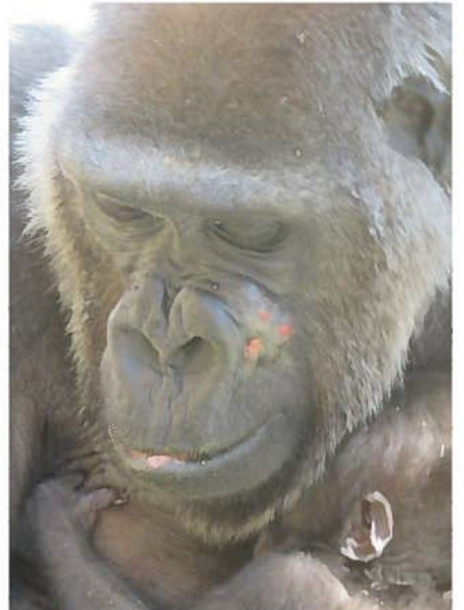
↑可愛いゲンキの顔が台無し… 現在は少し傷が残る程度です。

動物の生態や行動を正しく知ることは本当に大事です。人の無知のためにこんな事態になってしまい、ゲンキには本当に申し訳ない気持ちでいっぱいです…今私たちにできること、ゲンキの免疫力が落ちないように、できるだけ体調のいい状態を保つことを心がけて、日々の健康管理を精一杯頑張ろうと思います。そしてなるべく早く根本治療をしてあげたいと思っています。