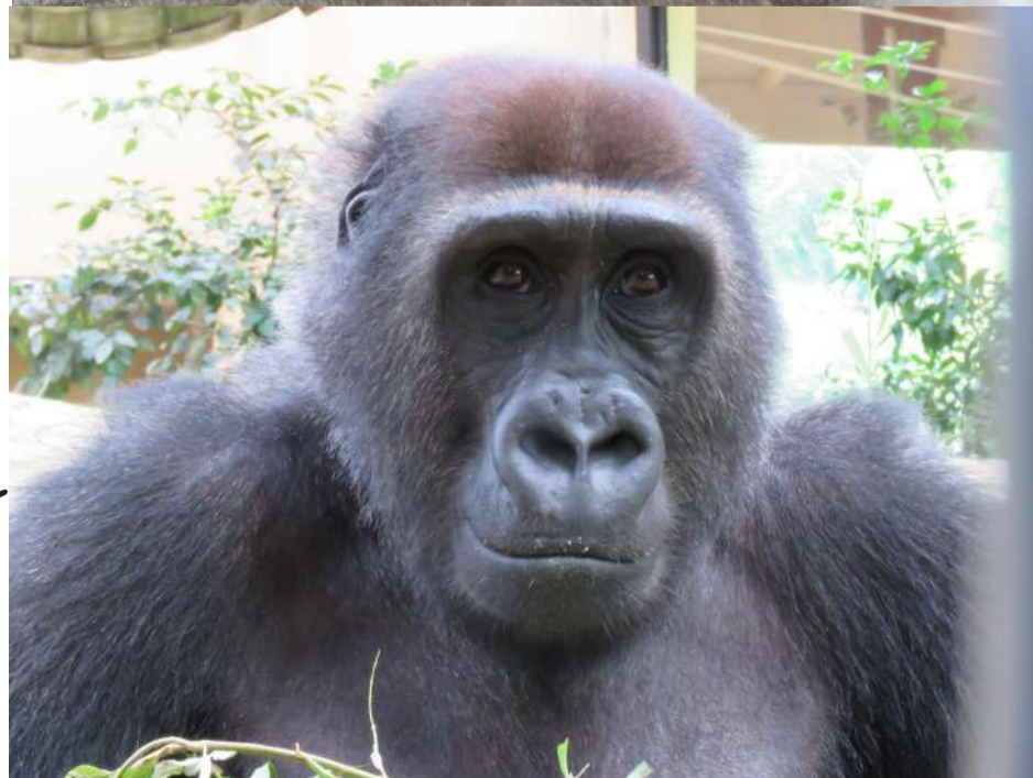
↑ゲンキ（上）とゲンタロウ（下）。 ゲンタロウは全体的にはゲンキ似ですが、ツルツルの鼻はモモタロウと一緒に♪