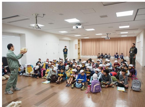
小学生への講演見学