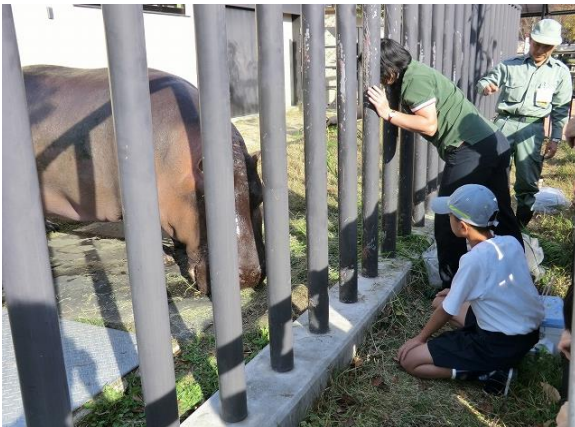
アフリカの草原 カバ舎