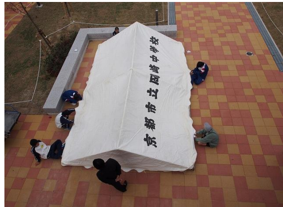
イベントに向けたテント設営