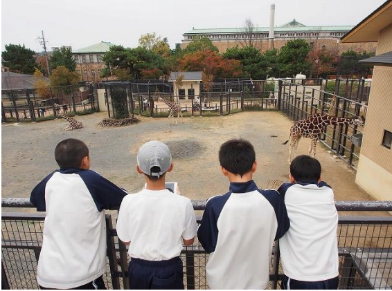
タブレットを活用した動物行動観察