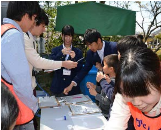
水質検査をします。