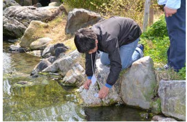
水を採取して・・・