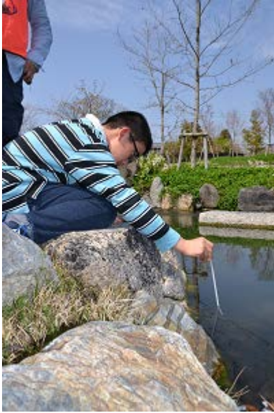
各場所の水温を測り・・・