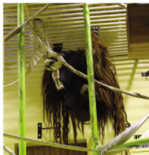
『新しい部屋の居心地はどうか?』