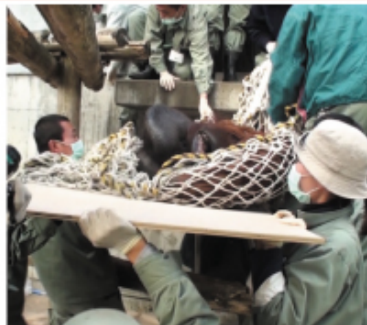
『ホップをネットでくるみ 運び出します。』