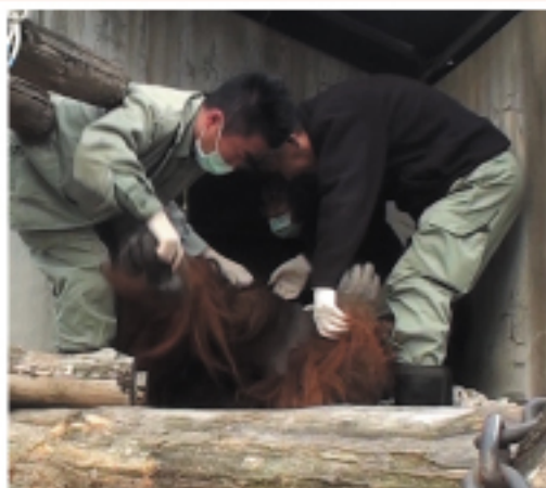
『麻酔をかけ、眠ったところで みんなでよっこいしょ!』