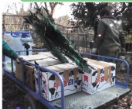
『立派なオスの上尾筒(尾羽 の上の羽)は折れないよう に運びましょう。』