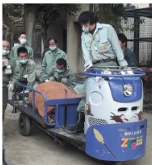
『園内運搬車に乗せて 類人猿舎へ出発～』