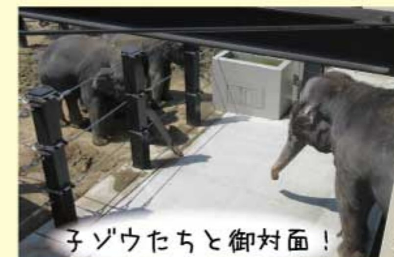
子ゾウたちと御対面!