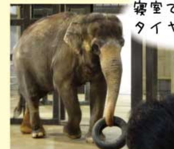
寝室で タイヤ遊び♪