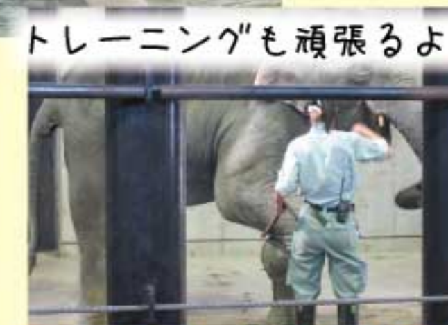
トレーニングも頑張るよ!