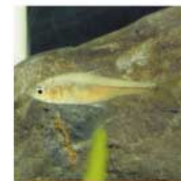
『イチモンジタナゴ』