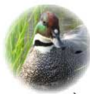
野生のカモが遊びに来ているカモ!?