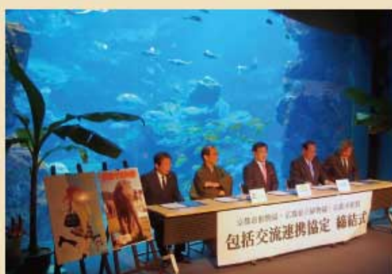
『連携協定締結式(水族館)』

第1回は植物園で、第2回は動物園で行いました。11月15日には、動物園で開催するサガ・シンポジウムの一部として、活動報告のシンポジウムを実施予定です。お楽しみに！