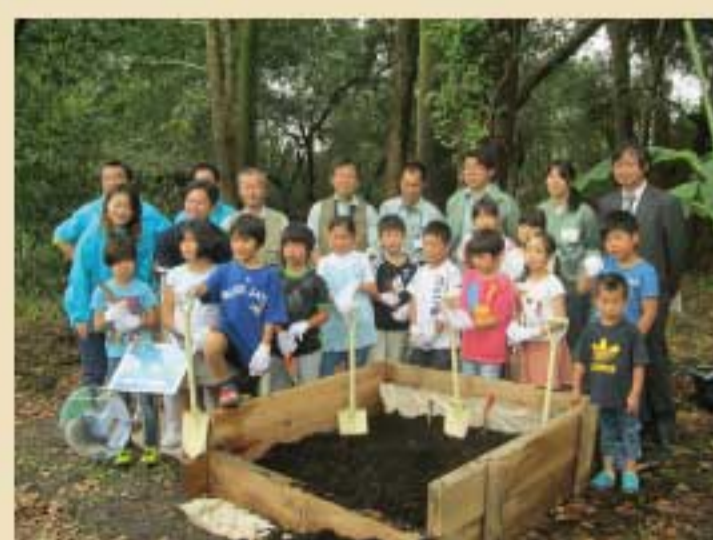
『第1回ワークショップ』 ゾウさん、オットセイさんの ウチでバナナを育てる