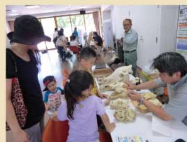
『第2回ワークショップ』 夏休みの宿題いきもの相談会