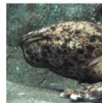
『オオサンショウウオ』