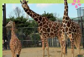
ヨシダ&キヨミズ&ミライ (キリンのキ)