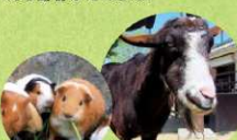
(テンジクネズミ) ホルス (ヤギキ)