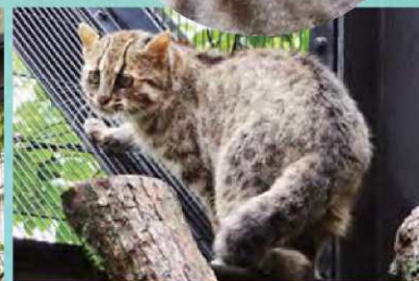
上：ツシマヤマネコは、ベンガルヤマネコの亜種とされています。