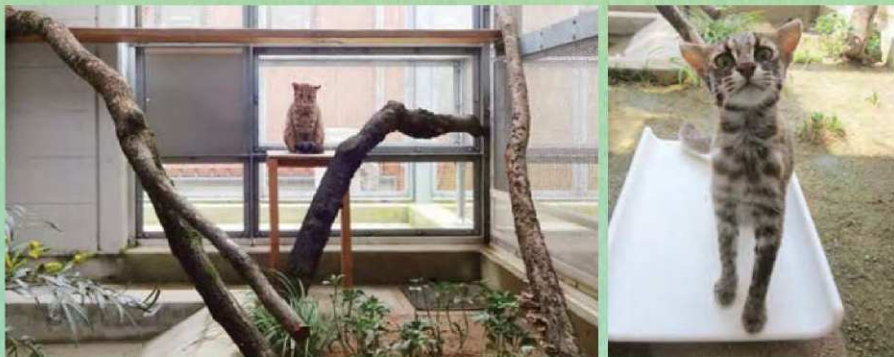
左：「ツシマヤマネコ繁殖棟」の中の様子。右：体調の管理がしやすいように、トレーニングをしています。これは体重計に乗っているところです。 <動物園のホームページなどで、繁殖棟でのヤマネコたちの様子をお知らせしています。>

「ツシマヤマネコ繁殖棟」には、複数の部屋とグラウンドがあり、それぞれの部屋をつなぐキャットウォーク（ネコ専用の通路）を設置しています。繁殖期以外は単独生活をする動物なので、普段はそれぞれの部屋で生活していますが、自然に行き来して、お見合いしやすいようになっています。また、観察用カメラでヤマネコたちの行動を観察しています。警戒心の強いツシマヤマネコたちは、飼育員にもなかなかリラックスした姿を見せませんが、カメラを通して、時折くつろいだ様子を見ることができます。