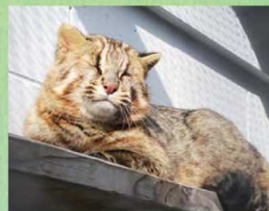
高い場所で休んでいるところ。

個体数を増やすこと。将来的には、野生復帰につなげることも視野に入れています。ストレスを軽減し、感染症のリスクを避け、ツシマヤマネコたちに安心して過ごしてもらうために、「非公開」は大切なことなのです。動物園には、教育、レクリエーション、研究の施設としての役割のほかに、絶滅のおそれがある動物たちを守る「保全」という役割があります。「ツシマヤマネコ繁殖棟」は、まさにその最前線なのです。