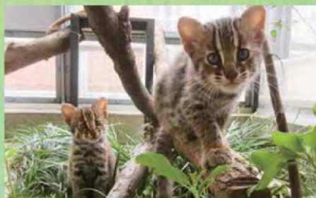
生後約2か月。あどけなさの中にも、ツシマヤマネコらしい精神な表情がのぞきます。