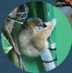
照明は、展示されている動物たちの負担になりにくい赤色です。