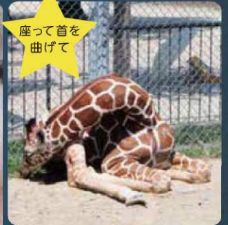
首を曲げて休む時間は短く、京都市動物園の調査では一晩で長くても20分ほどでした。