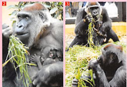
1 父モモタロウ(左)、母ゲンキ(中央)、ゲンタロウ(右)。ニシゴリラの一家に新しい家族が増えました。赤ちゃん誕生前の1枚です。2 赤ちゃんと母ゲンキはいつも一緒です。3 ゲンキは赤ちゃんを抱っこしながら、長男ゲンタロウのことも見守っています。

野生のニシゴリラは西アフリカの熱帯雨林に生息しており、すみかの環境破壊と密猟によって数が減少し、ワシントン条約で絶滅の恐れが最も高い種に指定されています。希少種の保護や繁殖は動物園の重要な役割で、当園でも積極的に取り組んできました。