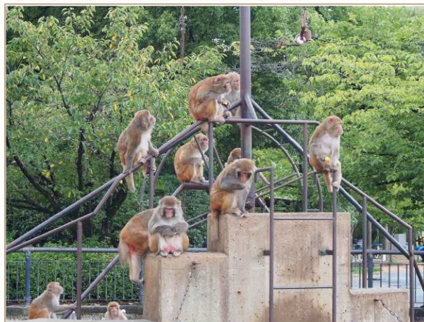
もって来てくれた児童もしっかりと観察してくれていました。