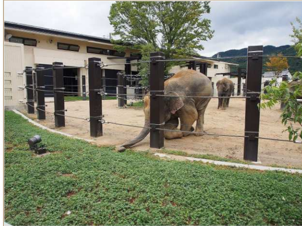
そこで、今回は美都にプレゼント！