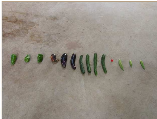
あっという間にペロリと食べてしまいました。※画像をクリックしていただくと動画をご覧ください。