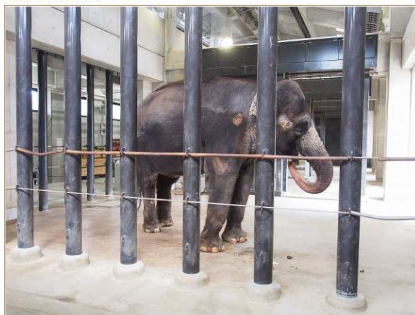
もちろん足りないので、グラウンドの草を引き抜いていました。