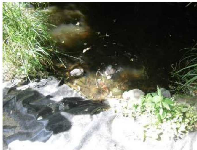
【学校の様子】 2016-05-14 16:13 up!