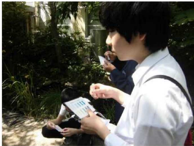
【学校の様子】 2016-05-14 16:55 up!